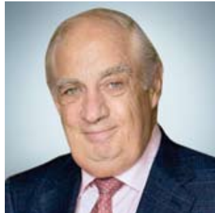
Peter Dennis Sutherland Üye

Yüksek öğrenimini Erlangen-Nuremberg Üniversitesi (Almanya) Hukuk ve Ekonomi bölümlerinde yapmıştır. 1969 yılında Siemens AG'de çalışmaya başlayan ve kurum bünyesinde önemli görevler alan V. Pierer, en son 2005-2007 yılları arasında Siemens Yönetim Kurulu Başkanlığı'nı üstlenmiştir. 1993-2006 yılları arasında Alman İş Dünyası Asya-Pasifik Komitesi Başkanlığı'nı da yürütmüş olan V. Pierer, Erlangen Friedrich Alexander Üniversitesi'nden Endüstriyel Ekonomi alanında şeref doktora sahibidir. 2008'den bu yana Koç Holding Yönetim Kurulu Üyesi'dir.