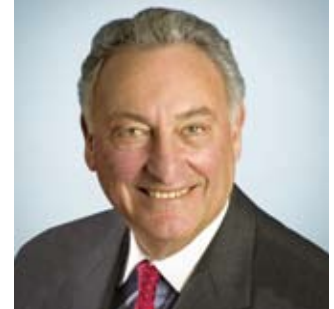
Sanford I. Weill Üye