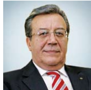
Kutsan Çelebican Üye

Gonzaga College, University College Dublin ve King's Inns'de Medeni Hukuk eğitimi görmüştür. İrlanda Başsavcısı (1981-1984), Rekabet Politikasından Sorumlu Avrupa Komisyonu Komiseri (1985-1989), Dünya Ticaret Örgütü Direktörü (1993-1995), BP Plc Yönetim Kurulu Başkanı (1997 - 2009) olarak görev yapmıştır. 1995'ten beri Goldman Sachs Intl. ve London School of Economics Yönetim Kurulu Başkanlığı'nın yanı sıra BM Göç ve Kalkınma Özel Temsilciliği yapmaktadır. Allianz ve BW Group Ltd. Yönetim Kurulu, Eli Lilly Danışma Kurulu, Dünya Ekonomik Forumu Mütevelli Kurulu Üyeliği, Avrupa Üçlü Komisyon Yönetim Kurulu Başkanlığı, The Federal Trust Başkanlığı diğer görevleri arasındadır. Avrupa ve Amerika'daki on beş üniversiteden fahri doktora unvanı, sayısız yayını ve ödülü vardır. 2009'dan bu yana Koç Holding Yönetim Kurulu Üyesi'dir.