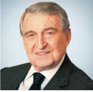
Rahmi M. Koç Şeref Başkanı

Yüksek öğrenimini Johns Hopkins Üniversitesi (ABD) Endüstriyel Sevkiyat ve İdare Bölümü'nde yapmıştır. Çalışma hayatına Koç Topluluğu'nda 1958 yılında Otokoç A.Ş.'de başlamıştır. Koç Holding bünyesinde çeşitli üst düzey görevlerde bulunmuştur. 1980 yılında İdare Komitesi Başkanı olduktan sonra, 1984 yılında Koç Holding Yönetim Kurulu Başkanı olarak atanmıştır. 2003 yılından itibaren de Koç Holding Şeref Başkanı unvanıyla çalışmalarını sürdürmektedir. 1995-1996 yıllarında Uluslararası Ticaret Odası Başkanlığı yapan Rahmi Koç, Vehbi Koç Vakfı Mütevelli Heyeti Başkan Vekilliği, Koç Üniversitesi Mütevelli Heyeti Başkanlığı, Rahmi M. Koç Müzecilik ve Kültür Vakfı Kurucusu ve Yönetim Kurulu Başkanlığı, VKV Amerikan Hastanesi Yönetim Kurulu Başkanlığı, TURMEPA/Deniz Temiz Derneği Kurucu Üyesi ve Onursal Başkanlığı, TÜSİAD Yüksek İstisare Konseyi Onursal Başkanlığı, TISK Danışma Kurulu Üyeliği, Foreign Policy Association Fahri Üyeliği, New York Metropolitan Sanat Müzesi Onursal Mütevelli Heyeti Üyeliği ve Allianz AG Uluslararası Danışma Kurulu Üyeliği gibi görevleri de yürütmektedir.