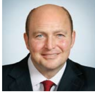
Mustafa V. Koç Başkan

Yüksek öğrenimini Johns Hopkins Üniversitesi (ABD) Endüstriyel Sevkiyat ve İdare Bölümü'nde yapmıştır. Çalışma hayatına Koç Topluluğu'nda 1958 yılında Otokoç A.Ş.'de başlamıştır. Koç Holding bünyesinde çeşitli üst düzey görevlerde bulunmuştur. 1980 yılında İdare Komitesi Başkanı olduktan sonra, 1984 yılında Koç Holding Yönetim Kurulu Başkanı olarak atanmıştır. 2003 yılından itibaren de Koç Holding Şeref Başkanı unvanıyla çalışmalarını sürdürmektedir. 1995-1996 yıllarında Uluslararası Ticaret Odası Başkanlığı yapan Rahmi Koç, Vehbi Koç Vakfı Mütevelli Heyeti Başkan Vekilliği, Koç Üniversitesi Mütevelli Heyeti Başkanlığı, Rahmi M. Koç Müzecilik ve Kültür Vakfı Kurucusu ve Yönetim Kurulu Başkanlığı, VKV Amerikan Hastanesi Yönetim Kurulu Başkanlığı, TURMEPA/Deniz Temiz Derneği Kurucu Üyesi ve Onursal Başkanlığı, TÜSİAD Yüksek İstisare Konseyi Onursal Başkanlığı, TISK Danışma Kurulu Üyeliği, Foreign Policy Association Fahri Üyeliği, New York Metropolitan Sanat Müzesi Onursal Mütevelli Heyeti Üyeliği ve Allianz AG Uluslararası Danışma Kurulu Üyeliği gibi görevleri de yürütmektedir.