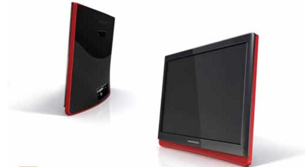
Grundig Chameleon 2 18,5" LCD TV, İnovasyon ve tasarımın sembolü olarak Chicago Athenaeum Müzesi tarafından 2008 GOOD DESIGN ödülüne layık görülmüştür.