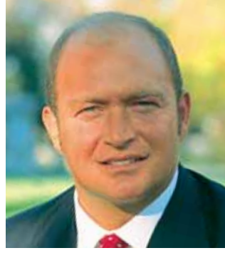
Mustafa V. Koç Başkan

Yüksek öğrenimini Johns Hopkins Üniversitesi (ABD) Endüstriyel Sevk ve İdare Bölümü'nde yapmıştır. Koç Topluluğu'nda 1958 yılında Otokoç şirketinde işe başlamıştır. Koç Holding bünyesinde çeşitli üst düzey görevlerde bulunmuştur. 1980 yılında İdare Komitesi Başkanı olduktan sonra 1984 yılında Koç Holding Yönetim Kurulu Başkanı olarak atanmıştır. 2003 yılından itibaren de Koç Holding Şeref Başkanı unvanıyla çalışmalarını sürdürmektedir. Aynı zamanda Vehbi Koç Vakfı Mütevelli Heyeti Başkan Vekilliği, Koç Üniversitesi Mütevelli Heyeti Başkanlığı, Rahmi M. Koç Müzecilik ve Kültür Vakfı kurucusu ve Yönetim Kurulu Başkanlığı, VKV Amerikan Hastanesi Yönetim Kurulu Başkanlığı, TURMEPA/DenizTemiz Derneği kurucusu ve Onursal Başkanlığı, TÜSIAD Yüksek İstişare Şeref Başkanlığı ve TİSK Danışma Kurulu Üyeliği gibi görevleri de yürütmektedir.