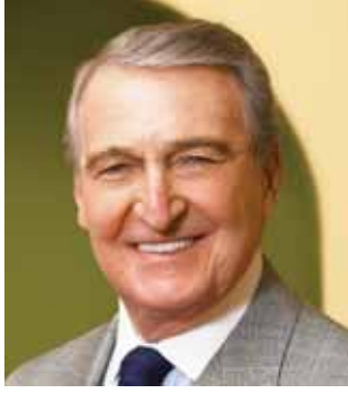
Rahmi M. Koç Şeref Başkanı

Yüksek öğrenimini Johns Hopkins Üniversitesi (ABD) Endüstriyel Sevk ve İdare Bölümü'nde yapmıştır. Koç Topluluğu'nda 1958 yılında Otokoç şirketinde işe başlamıştır. Koç Holding bünyesinde çeşitli üst düzey görevlerde bulunmuştur. 1980 yılında İdare Komitesi Başkanı olduktan sonra 1984 yılında Koç Holding Yönetim Kurulu Başkanı olarak atanmıştır. 2003 yılından itibaren de Koç Holding Şeref Başkanı unvanıyla çalışmalarını sürdürmektedir. Aynı zamanda Vehbi Koç Vakfı Mütevelli Heyeti Başkan Vekilliği, Koç Üniversitesi Mütevelli Heyeti Başkanlığı, Rahmi M. Koç Müzecilik ve Kültür Vakfı kurucusu ve Yönetim Kurulu Başkanlığı, VKV Amerikan Hastanesi Yönetim Kurulu Başkanlığı, TURMEPA/DenizTemiz Derneği kurucusu ve Onursal Başkanlığı, TÜSIAD Yüksek İstişare Şeref Başkanlığı ve TİSK Danışma Kurulu Üyeliği gibi görevleri de yürütmektedir.