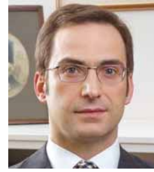
Ömer M. Koç Başkan Vekili

İTÜ Makine Mühendisliği'nin ardından Wayne State Üniversitesi (ABD) İşletme Bölümü'nde ihtisas yapmıştır. Koç Topluluğu'na 1966 yılında katılmış; Otoyal Sanayi A.Ş. ve Tofaş Türk Otomobil Fabrikası A.Ş. Genel Müdürlüğü görevlerinin yanı sıra Koç Holding bünyesinde çeşitli üst düzey görevler aldıktan sonra 2000-2001 yıllarında Koç Holding CEO'lüğünü yapmıştır. 1996 yılında beri üyesi olduğu Yönetim Kurulu'nda 1998 yılından bu yana Koç Holding Yönetim Kurulu Başkan Vekili olarak görev almaktadır.